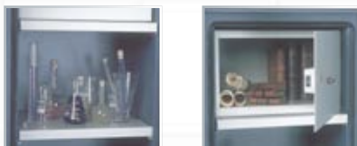
Equipements intérieurs (en partant de la gauche) : tablette, armoire à clé