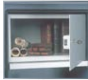
De gauche à droite : tablette, armoire intérieure.